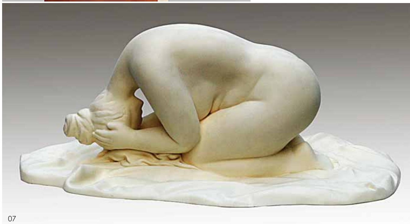
06 平安夜 黄成章 07 冬 沈允庆