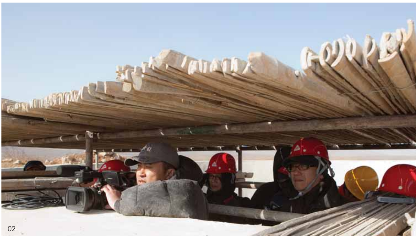
02 作者和工作人员在掩体下